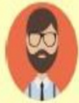
ผู้แทนโดย ชอบธรรม