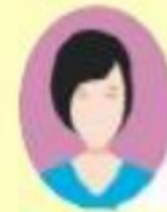
บิดา มารดาและ ผู้ปกครอง