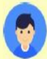
ผู้กู้ยืมเงิน